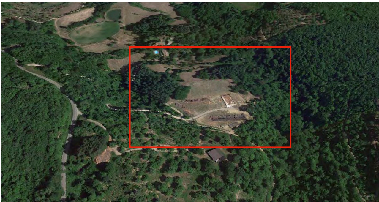
IC 6.2, veduta obliqua dell'area di intervento da sud