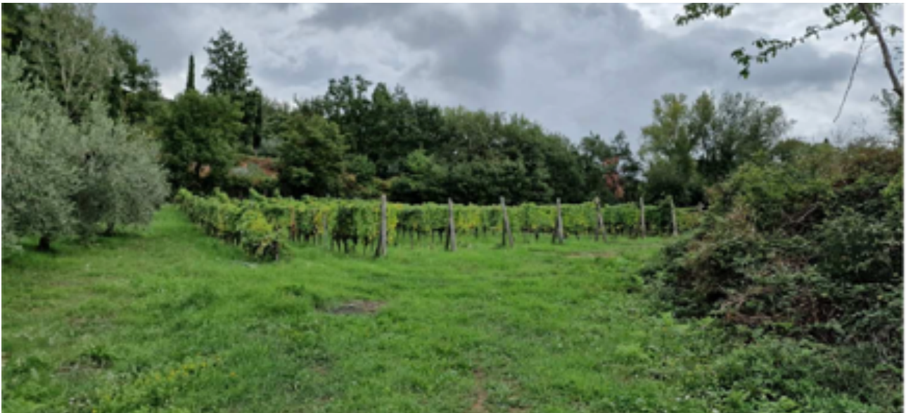
IC7.03, veduta obliqua dell'area di intervento con individuazione dell'area per l'edificio agricolo e il piazzale