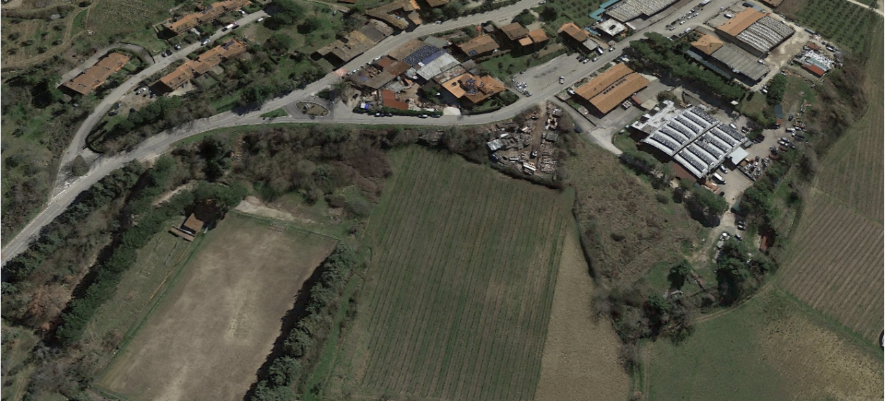
PA 7.2, veduta obliqua dell'area di intervento da nord

Per la progettazione degli spazi di aperti e pertinenziali, si dovrà fare riferimento alle linee guida regionali APEA, con particolare riferimento all'integrazione tra paesaggio ed insediamento produttivo e all'infrastrutturazione ecologica dell'area. In tal senso anche i parcheggi (pubblici e privati) a servizio del nuovo insediamento dovranno essere opportunamente alberati per l'ombreggiamento e la mitigazione dell'impatto visivo. Valgono inoltre le prescrizioni della scheda di vincolo di cui al documento denominato "Criteri e modalità di inserimento paesaggistico degli interventi" allegato alle presenti Norme.