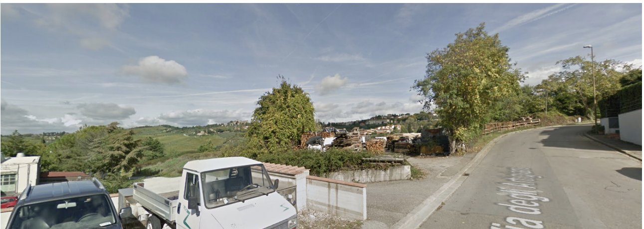
A 7.2, veduta obliqua dell'area di intervento da via degli Artigiani