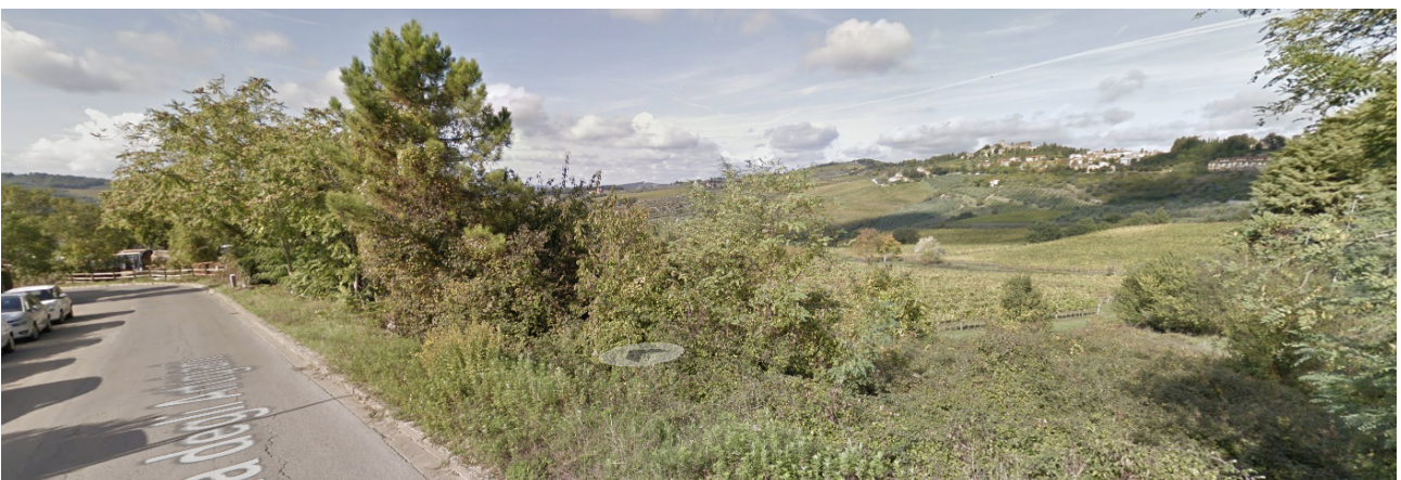
PA 7.2, veduta dell'area di intervento da via diella Conca d'Oro